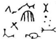
Pinturas encontradas na gruta

Surgiu assim o povoado conhecido como São Thomé. Na entrada da gruta foram descobertas pinturas em tom avermelhado semelhante a letras. atribuem-se essas pinturas aos índios cataguases, antigos habitantes da região, ou a seres extraterrenos vindos das estrelas e até mesmo a marcas deixadas pelo santo. A partir desse dia São Thomé passou a se chamar São Thomé das Letras.